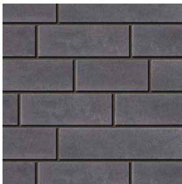
Noir Rockland - large