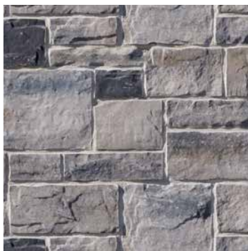
95 % Gris Chambord 5 % Noir Rockland