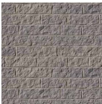
Gris et noir