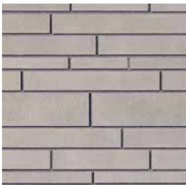
Héron - mix