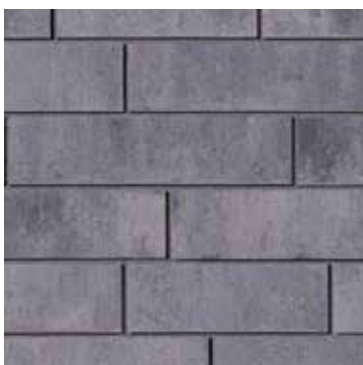
Gris Newport - large