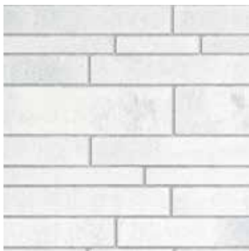
Blizzard - mix