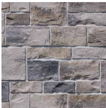
50 % Beige Margaux 50 % Gris Newport