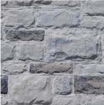
90 % Gris Scandina 10 % Gris Newport