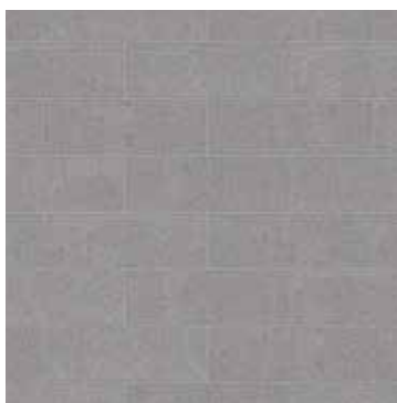
8 x 24 Milano Lisse