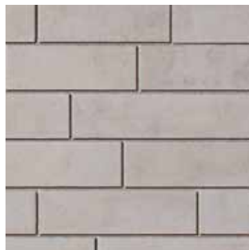
Héron - large