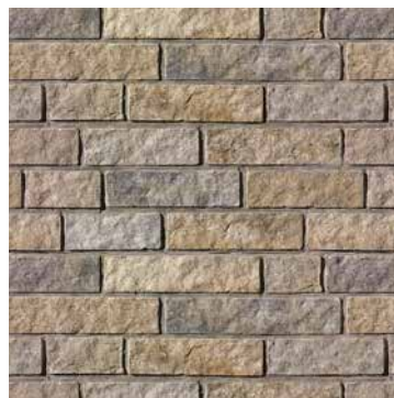
Gris Chambord Beige Amboise