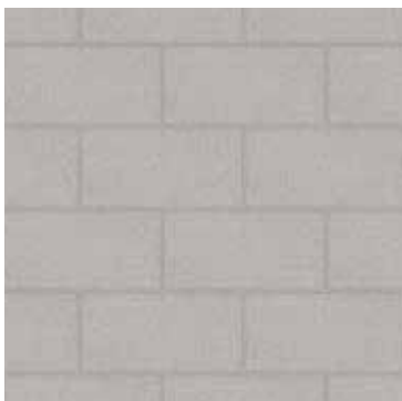
12 x 24 Calcaire Lisse