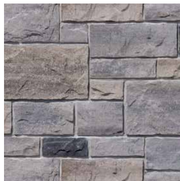
70 % Gris Chambord 25 % Beige Margaux 5 % Noir Rockland