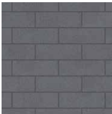
8 x 24 Graphite Lisse