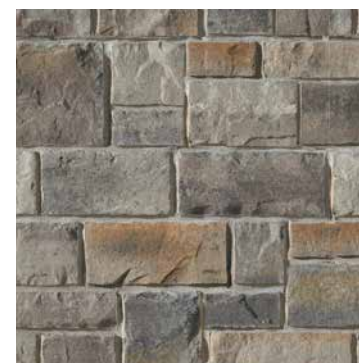
Gris Chambord Beige Amboise