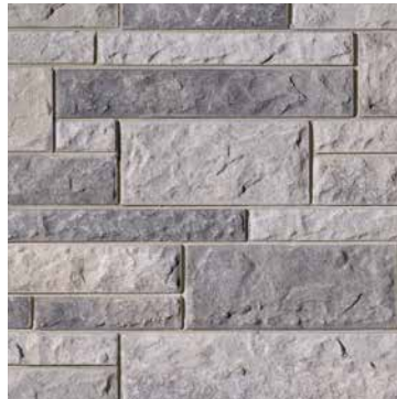
Gris Newport Gris Scandina