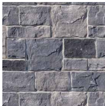
95 % Gris Newport 5 % Noir Rockland