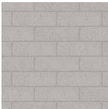
8 x 24 Calcaire Lisse