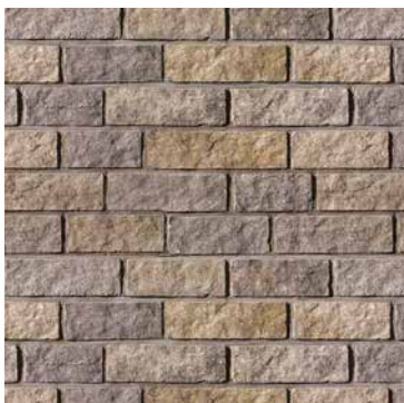
Beige Margaux Beige Amboise