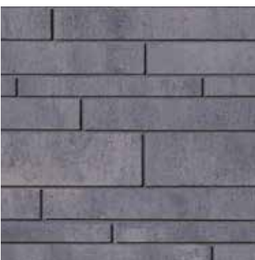
Gris Newport - mix