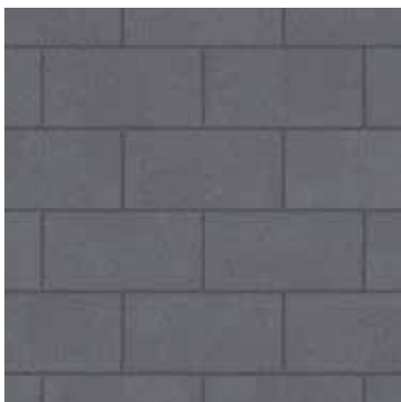
12 x 24 Graphite Lisse