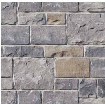
90 % Gris Newport 5 % Beige Amboise 5 % Noir Rockland