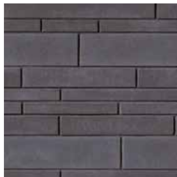
Noir Rockland - mix