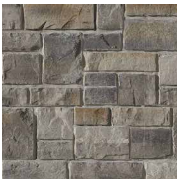
Beige Margaux Gris Chambord