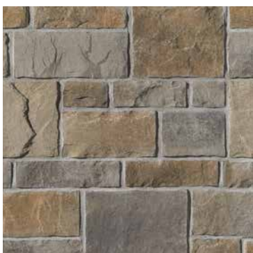
Beige Margaux Beige Amboise