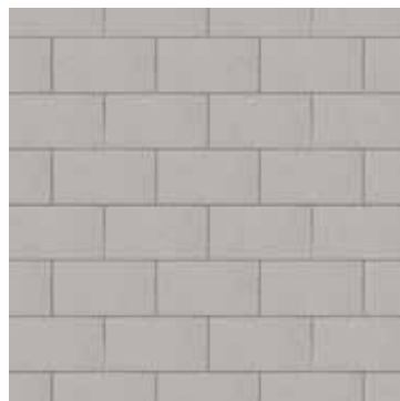
8 x 16 Calcaire Lisse