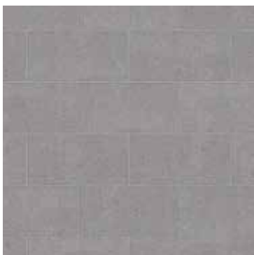
12 x 24 Milano Lisse