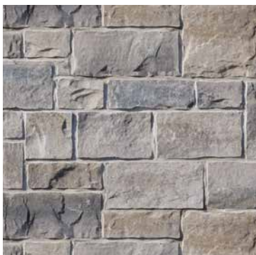
50 % Beige Margaux 50 % Gris Chambord