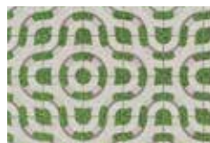
Motif de fleur