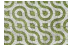
Motif de mosaïque