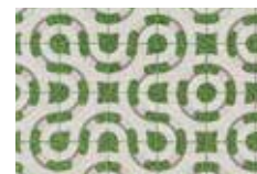
Motif de trèfle