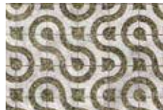
Motif de maillon