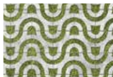
Motif de vague