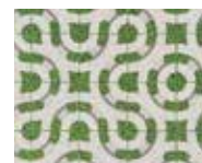
Motif de trèfle