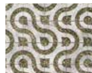
Motif de maillon