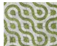
Motif de mosaïque