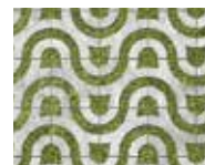
Motif de vague