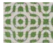
Motif de fleur